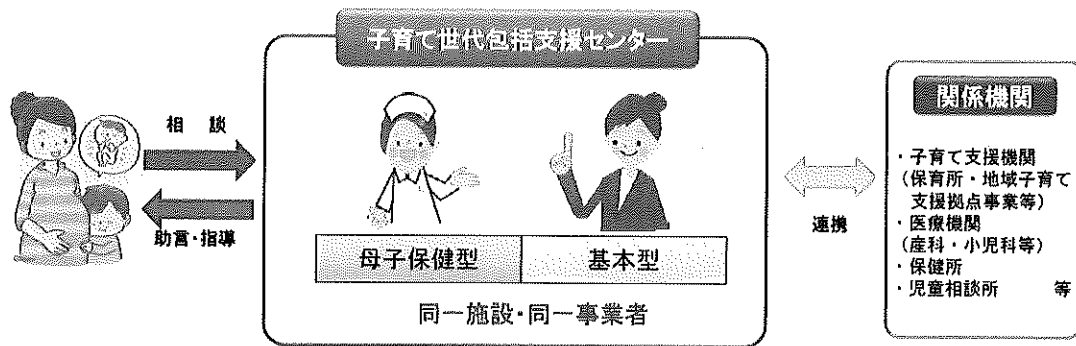
【妊娠期から子育て期にわたるまでの切れ目ない支援の実施】

子育て世代包括支援センターでは、子育てや子どもの預かりなどに関する相談支援や子育てサービスの利用支援のほか、保健師等の専門職員が全ての妊産婦の状況を把握し、支援プランを作成するなど、妊娠期から子育て期にわたる総合的な子育て支援を行います。