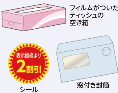
フィルムがついたティッシュの空き箱