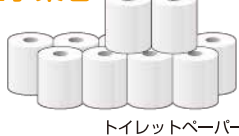
トイレトペーパー