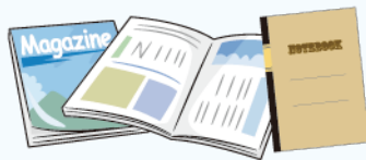
広報こまき、単行本、ノートなど