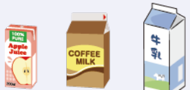
牛乳やジュースなどの紙パック