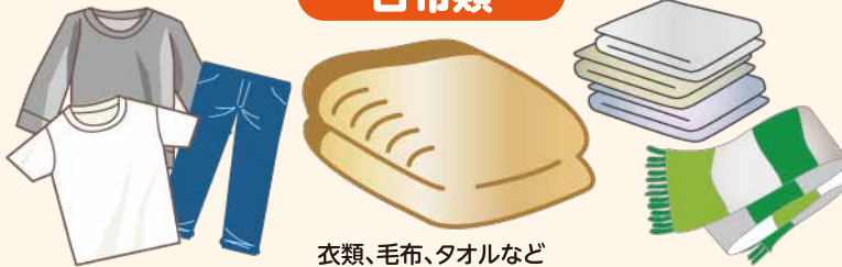
衣類、毛布、タオルなど