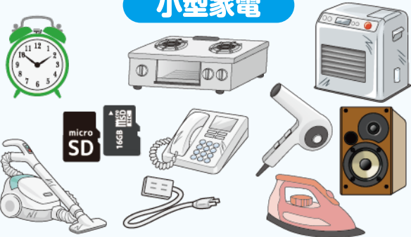
掃除機、アイロン、電話機など