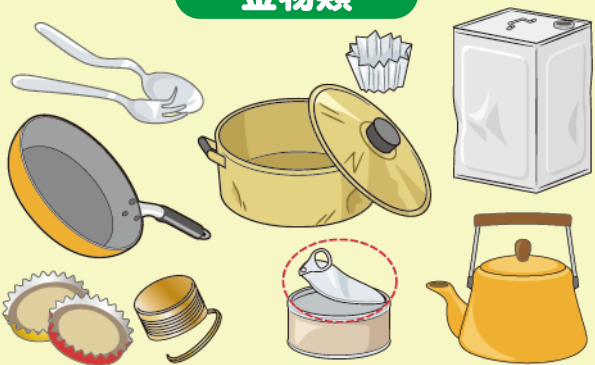
なべ、やかん、スプーンなど