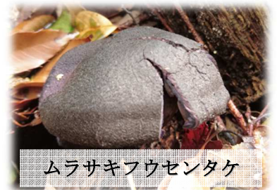
ムラサキフウセンタケ