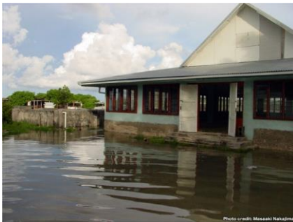
← 地球温暖化による海面水位上昇の被害

地球温暖化により、激しい雨が降って洪水が起こったり、南極の氷が溶けて海水の量が増えたりと様々な影響が出てきています。そのまま地球温暖化が進むと、世界中で異常気象や生物多様性への影響、農業への被害などが予測されています。