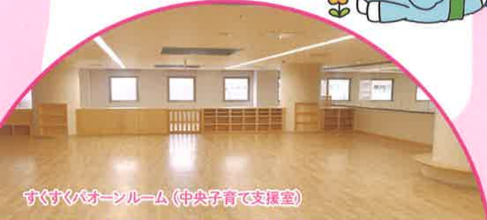
すくすくパオーンルーム(中央子育て支援室)