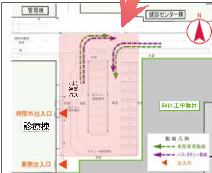
▲東ロータリー計画図