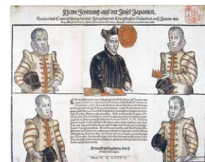
『天正遣欧少年使節肖像画』(京都大学附属図書館所蔵)