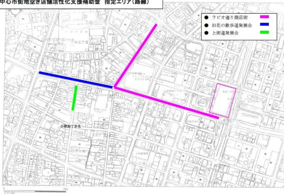
中心市街地空き店舗活性化支援補助金 指定エリア(路線)