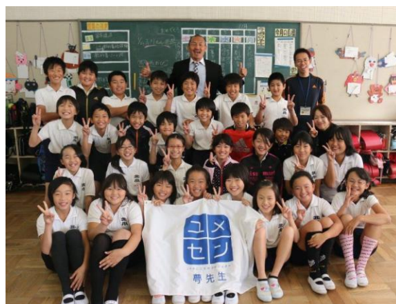
「夢の教室」開催の様子

海外有名クラブなどによる国内各地のジュニアサッカースクールを招聘し、小牧市スポーツ公園のサッカーグラウンドで、サッカースクールの交流大会を開催します。