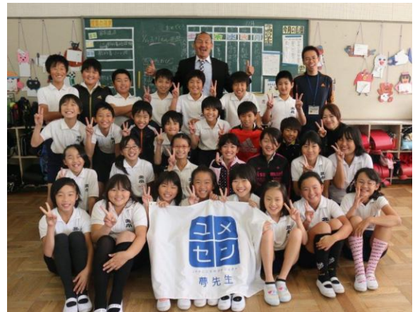
「夢の教室」開催の様子

トップアスリートなどが「夢先生」として自らの体験をもとに、「夢を持つこと、その夢に向かって努力することの大切さ」などを講義と実技を通して子どもたちに伝えることで、子どもの人格形成を支援する事業費の一部として使用しました。(市内全小学校16校、小5全クラスで実施。)