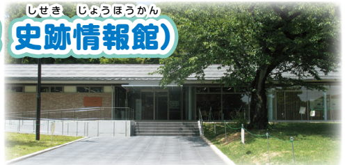
れきしるこまき (外観)

小牧山の ふもとにある 施設です。ここでは、小牧山の 歴史や 貴重な 自然に ついて 紹介しています。迫力のある 映像や 小牧山で 見つかった 石垣と 同じ 大きさの 模型、石を 積む 体験などが あります。れきしるこまきを 見た後、小牧山を 歩く コースも 紹介しています。