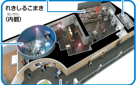
れきしるこまき (内観)