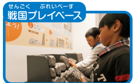
戦国プレイベース