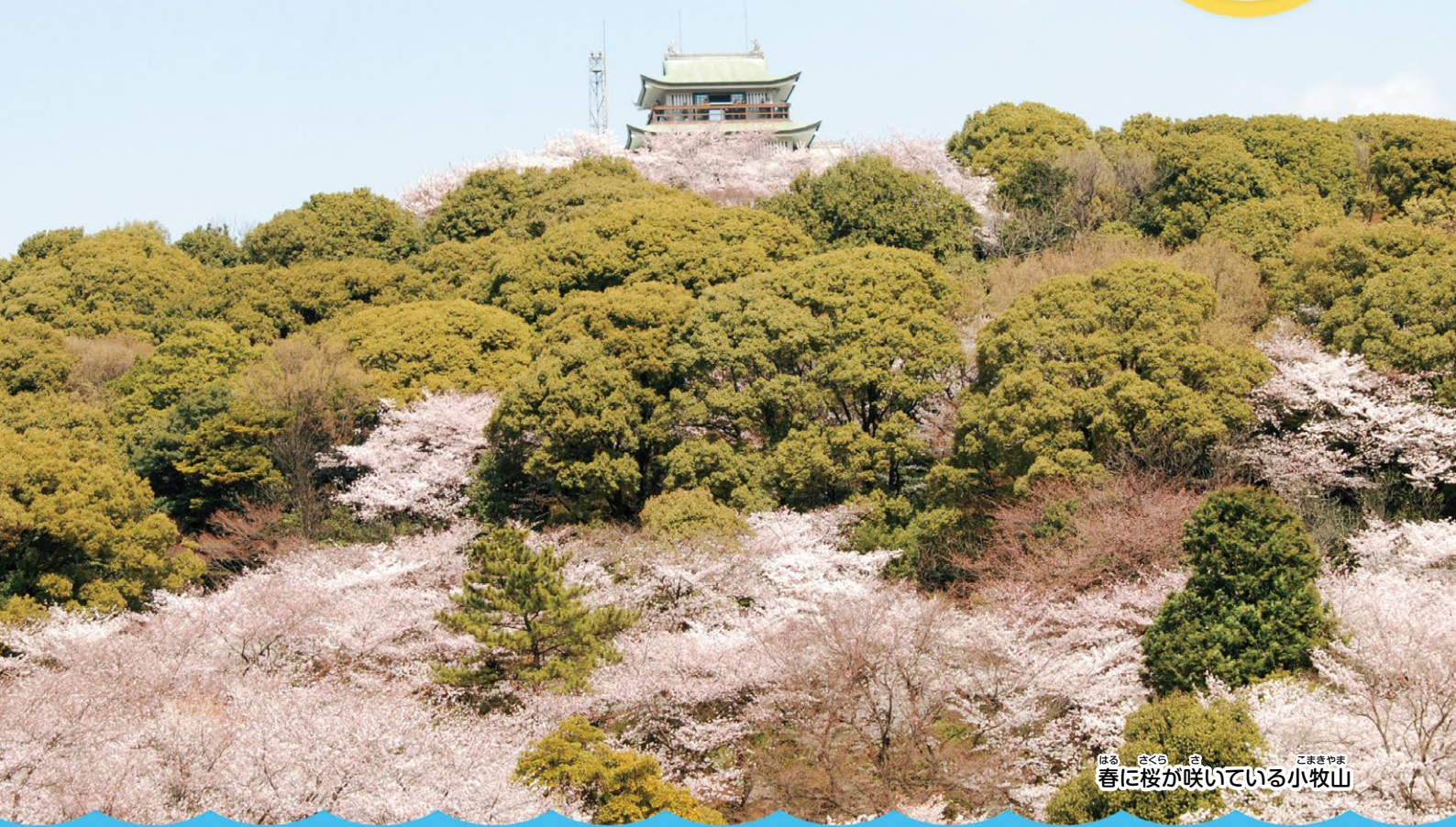
はる さくら さ 小まきやま 春に桜が咲いている小牧山