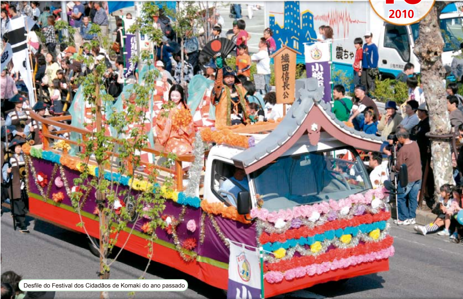
Desfile do Festival dos Cidadãos de Komaki do ano passado