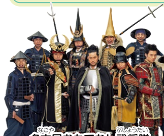
名古屋おもてなし武将隊