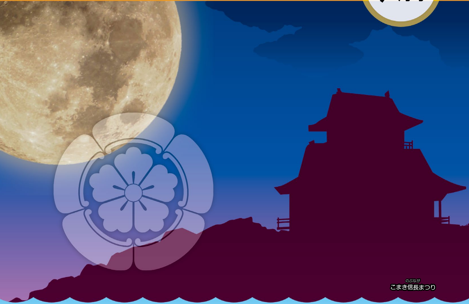
のぶなが こまき信長まつり