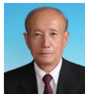
Atsushi Funahashi ① Partido Liberal Democrata ② 2 eleições (68 anos)