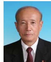
Vice-presidente da Assembleia: Atsushi Funabashi

estão sendo exatamente refletidas na administração pública, entre outras, também tem tornado-se cada vez maiores. Iremos trabalhar em cima de várias questões, começando pela construção do novo prédio da prefeitura no lado oeste do prédio da ala sul, sendo que o Município de Komaki com base no "6º Plano Geral" que é o nosso guia, está tendo os seus projetos avançando aos poucos. Entretanto, a economia japonesa recebeu um duro golpe devido ao Grande Terremoto do Leste do Japão, e há previsão de uma redução na renda dos impostos sobre pessoa jurídica. Também para o governo, está sendo cogitado o corte do subsídio passado aos governos locais e o cancelamento de várias medidas. Futuramente, concluiremos a reforma da assembleia de forma visível a todos, aplicando ao máximo nossas funções, sendo que sinto profundamente que a obrigação a mim imposta é de fazer com que os anseios de nossa população sejam refletidos na administração municipal, e desejo trabalhar com firme determinação. Peço a todos o máximo de apoio e estímulo agora e sempre.