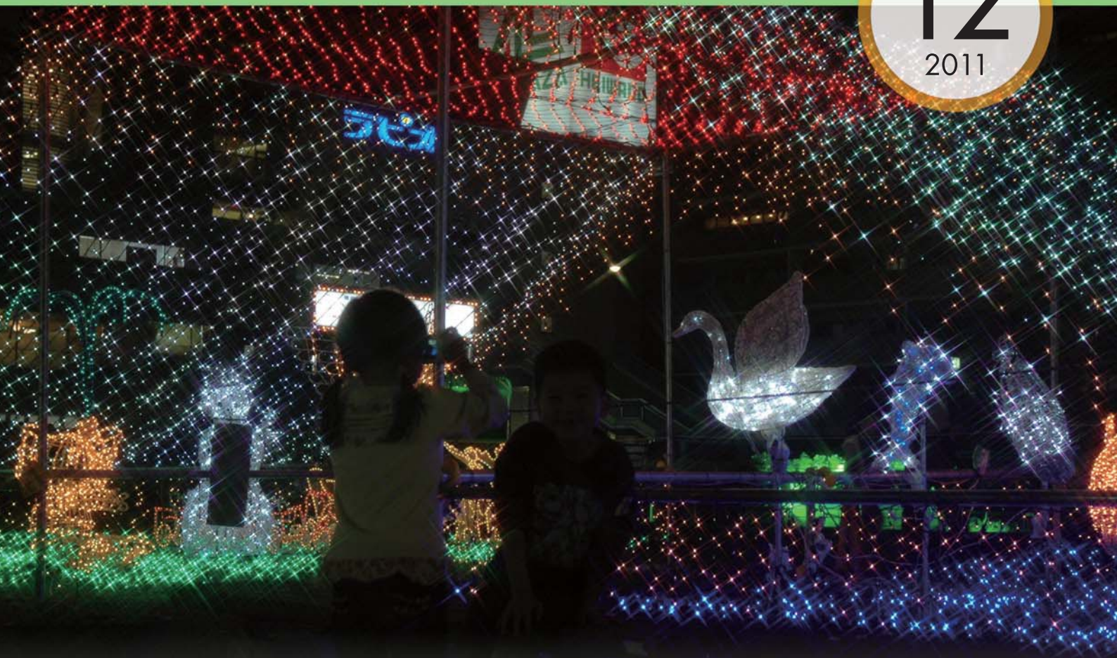
Iluminação em frente a Estação