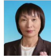
Satomi Takeuchi ① Partido Comunista Japonês ② 6 eleições (62 anos)