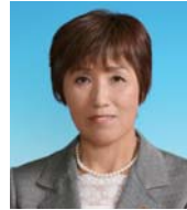
Miyoko Yasue ① Partido Comunista Japonês ② 5 eleições (56 anos)