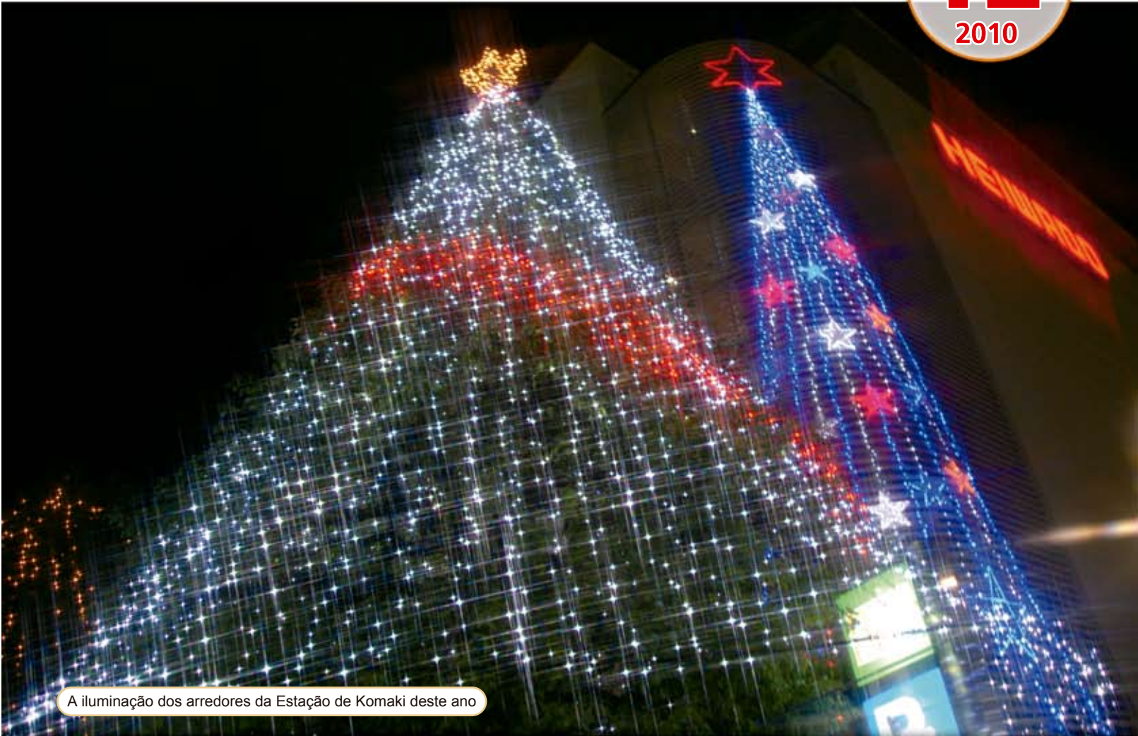
A iluminação dos arredores da Estação de Komaki deste ano