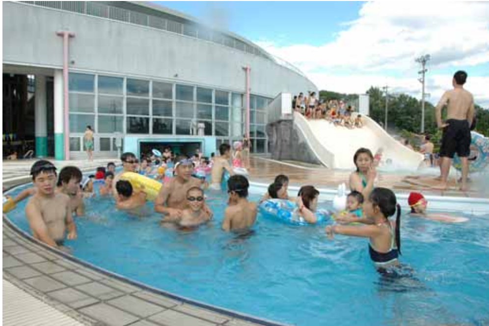
Picina Pública de Komaki ( Onsui Pool )