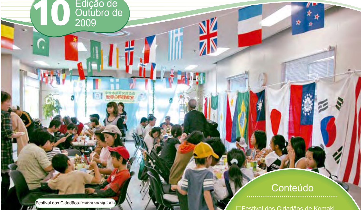
Festival dos Cidadãos (Detalhes nas pág. 2 e 3)