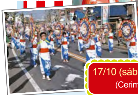
Festival dos Cidadãos de Komaki Mascote "Kiccho-chan"