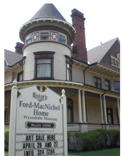
ワイアンドット市歴史館