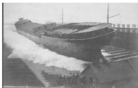
ワイアンドットに到着したボート

1732年 ヒューロン族（北米インディアン）の1種族であるワイアンドット族（the Wyandots）が現在のワイアンドット市のある地域にマクウアクウア村（Maquaqua）をつくった。