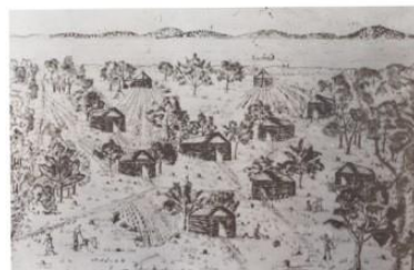
マクウアクウア村