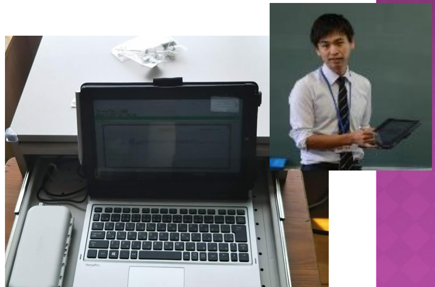
▲指導者用タブレットPC