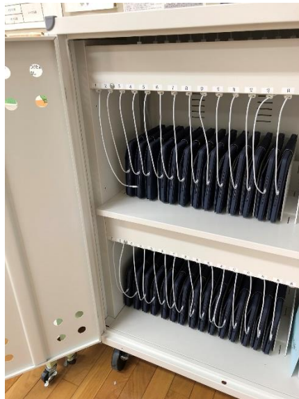
▲充電保管庫（小学校）