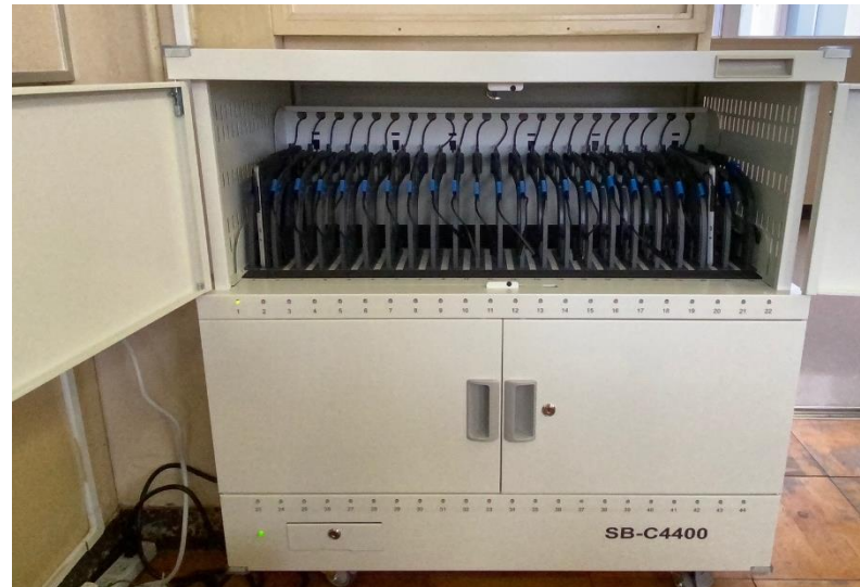
▲充電保管庫（中学校） （スイッチバック方式）