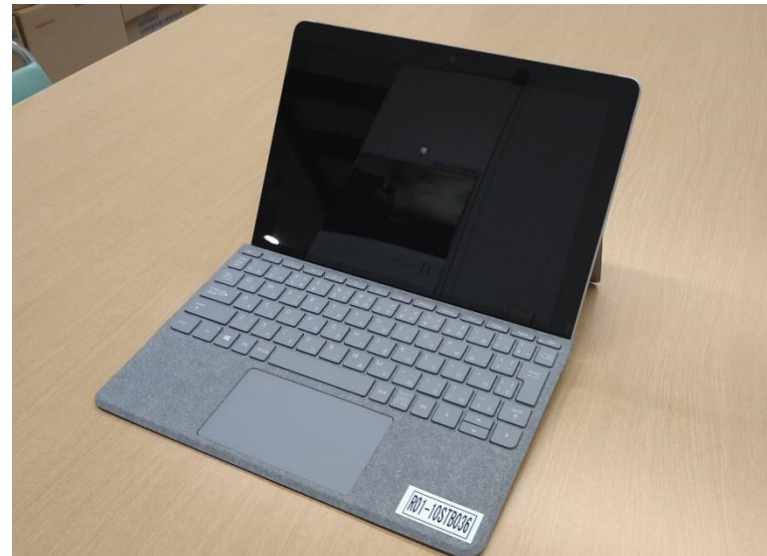
▲生徒用タブレット（Surface Go）