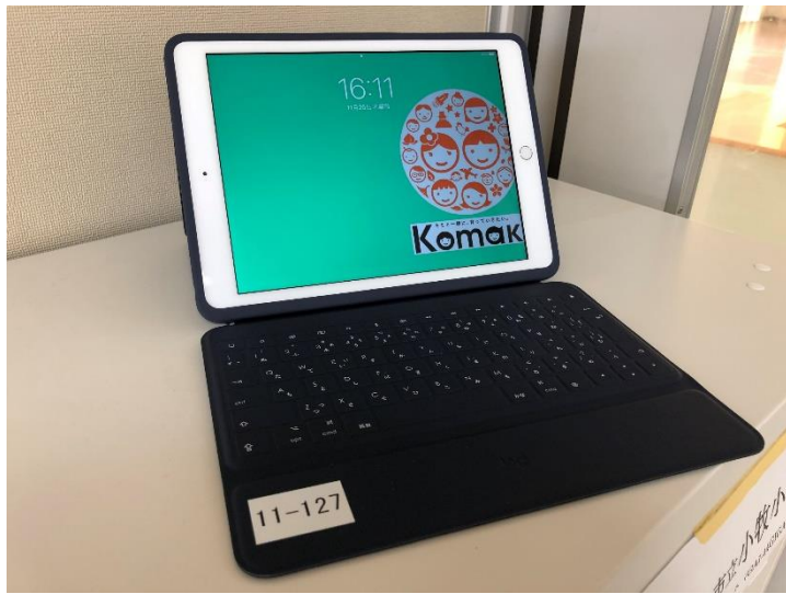
▲児童用タブレット（iPad）