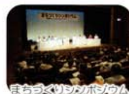
まちづくりシンポジウム

アンケートや懇談会、研究会、シンポジウムなどを通して、みなさんの多くの意見や提案が計画づくりに活かされています。