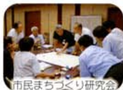
市民まちづくり研究会

アンケートや懇談会、研究会、シンポジウムなどを通して、みなさんの多くの意見や提案が計画づくりに活かされています。