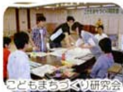
こどもまちづくり研究会