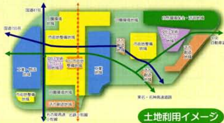
土地利用イメージ