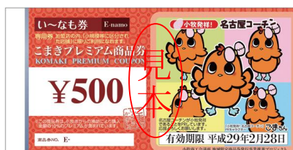
【小牧発祥】名古屋コーチン PRキャラクター「こまちゃん」