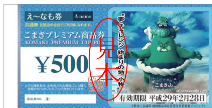
小牧市マスコットキャラクター 「こまき山」