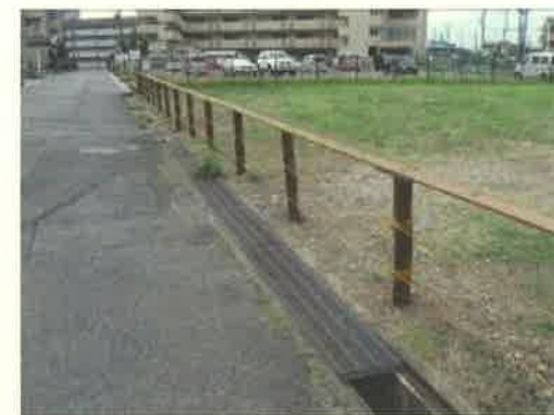
土地管理事業による 用地管理柵の修繕後