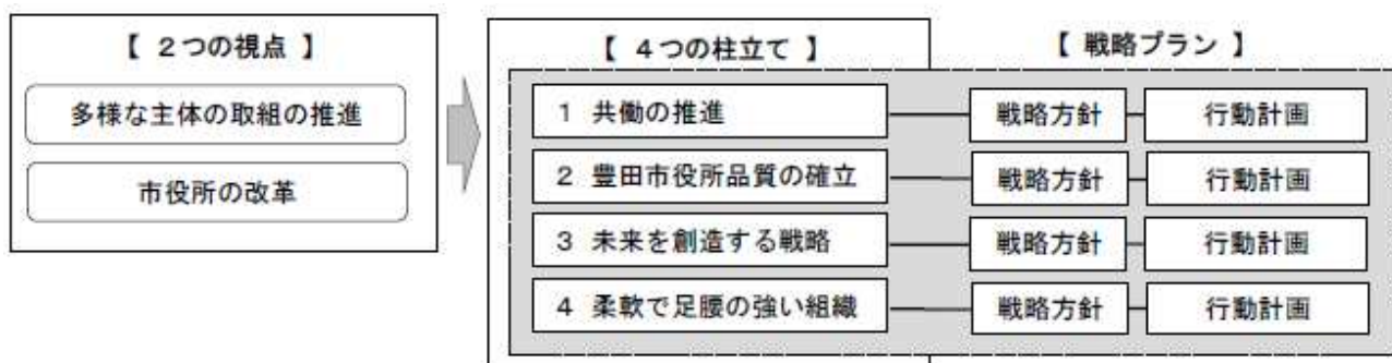
図表 戦略プランの構成