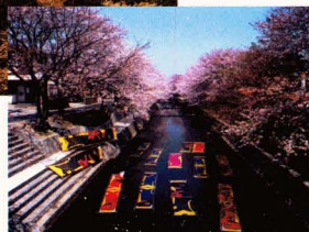
五条川のんぼり洗い(岩倉市)