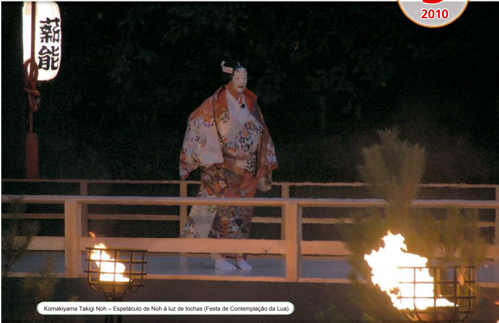
Komakiyama Takigi Noh – Espetáculo de Noh à luz de tochas (Festa de Contemplação da Lua)